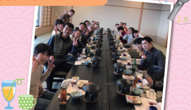
2020年1月19日(日) グループホーム

2020年も、皆さんが健康で元気に過ごせるよう、燕の戸隠神社でお祓いをしてもらいました。その後、寺泊の北新館さまで新年会を行いました。おいしいご飯を食べて、お風呂に入って、カラオケ大会をして…♪1年のはじまりに、楽しい時間を過ごせました。