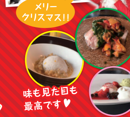
メリークリスマス!!